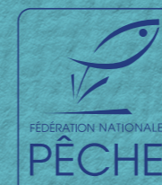
SCHÉMA DÉPARTEMENTAL DE DÉVELOPPEMENT DU LOISIR PÊCHE DE LA HAUTE-VIENNE