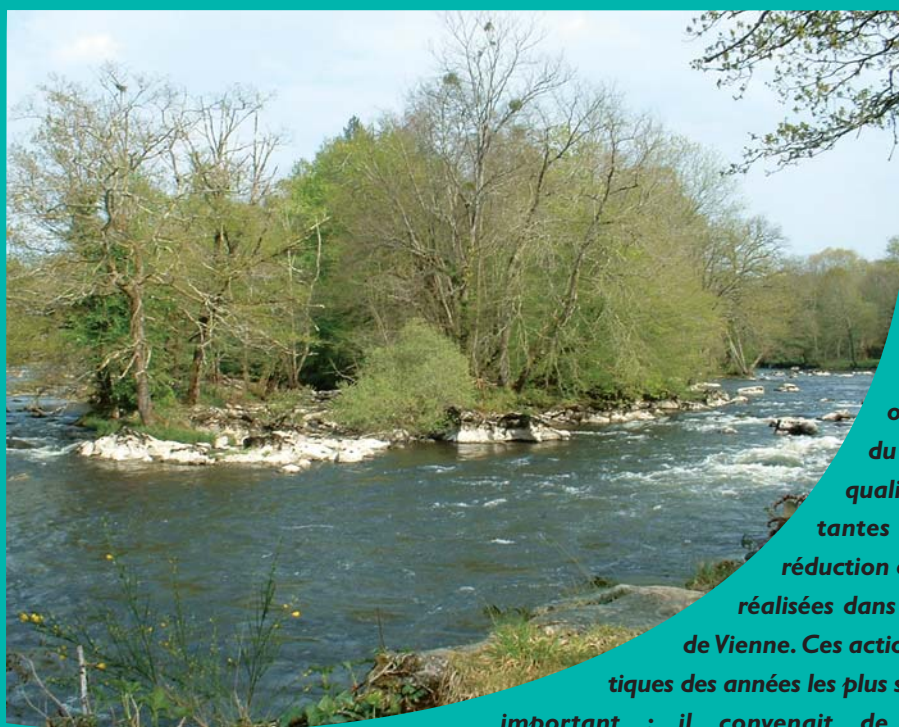
L'île du Daumail sur la Vienne à Verneuil sur Vienne

Dans le département de la Haute-Vienne, la vallée de la Vienne est un axe majeur de développement économique et touristique, aussi bien pour les communes que pour les groupements de communes qui bordent cette belle rivière. Sur tout ce territoire, l'essor industriel, les mutations du monde agricole et la disparition des activités traditionnelles ont entraîné une dégradation générale du milieu, et plus particulièrement de la qualité des eaux. De 1992 à 1997, d'importantes opérations d'assainissement et de réduction des flux polluants vers la Vienne ont été réalisées dans le cadre du plan d'action renforcé Val de Vienne. Ces actions ont permis d'éviter les situations critiques des années les plus sèches. Mais le travail à réaliser demeure important : il convenait de mettre en place une structure spécifique chargée d'organiser les interventions nécessaires.