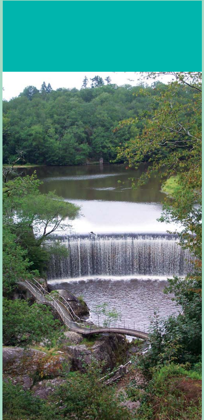
Le barrage du Gué Giraud sur la Glane à Saint-Junien

Le souhait du S.A.B.V.M. est donc d'orienter ses actions après concertation et communication avec toutes ces structures.