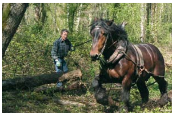
Débardage à cheval

en conservant des rivières sauvages. La priorité a donc été mise sur des actions d'enlèvement sélectif des embâcles et de restauration douce de la végétation des berges, de façon sélective et raisonnée, afin de conserver les lieux de caches pour la faune piscicole, de l'ombrage pour la rivière mais également de favoriser la stabilisation naturelle des berges par le système racinaire des végétaux présents.