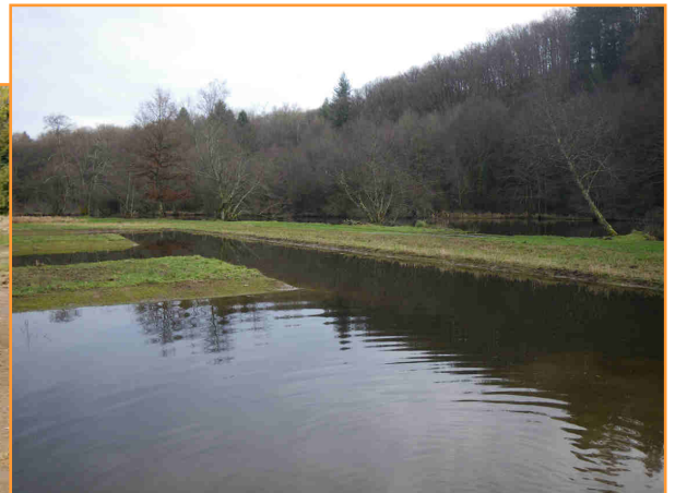
Résultat après les travaux (la végétation va se développer peu à peu).