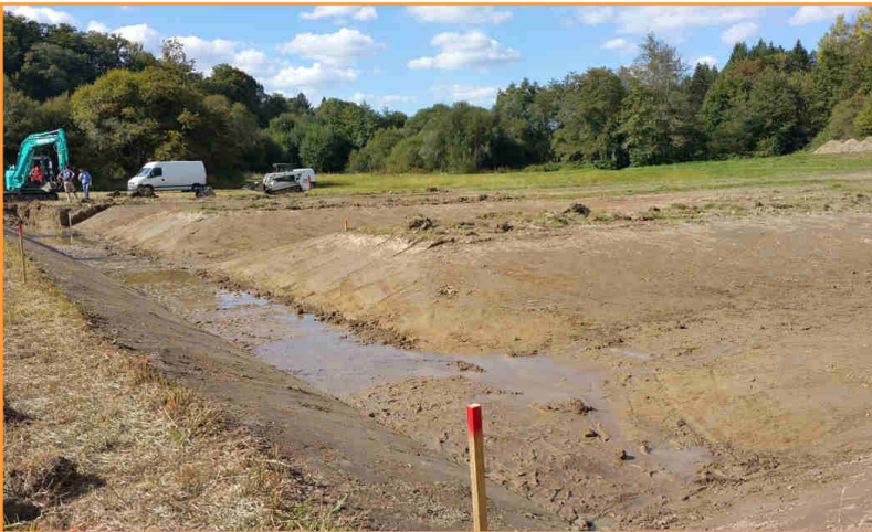
Pendant la phase de terrassement

Les pêcheurs s'investissent dans la protection du milieu aquatique avec cet ouvrage qui pérennisera la survie du super prédateur brochet dont l'espèce est fragile et menacée.