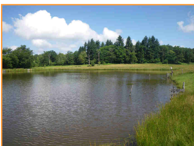
Le carpodrome situé au Rochelot, près de Saint-Junien.

Une seule canne autorisée avec ou sans moulinet montée d'un seul hameçon simple et sans ardillon numéro 8 maximum . Amorce limitée à 2kg + 1 litre d'esches animales par jour. Remise à l'eau obligatoire et immédiate. Voir réglementation affichée sur place.