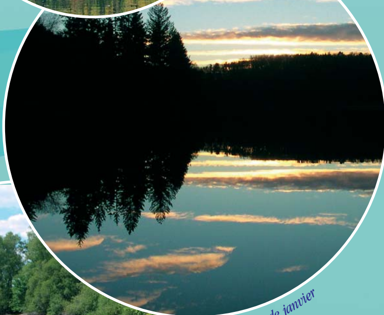
Crépuscule de janvier