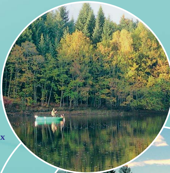
Le Mont-Larron en barque au mois de mai

Enfin, même si la loi autorise encore la capture de certaines espèces, il n'est pas recommandable, dans un souci de gestion, de conserver ses prises. Il est vrai que les perches peuvent sembler abondantes dans certains lacs, mais