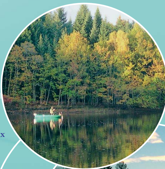
Le Mont-Larron en barque au mois de mai

Enfin, même si la loi autorise encore la capture de certaines espèces, il n'est pas recommandable, dans un souci de gestion, de conserver ses prises. Il est vrai que les perches peuvent sembler abondantes dans certains lacs, mais