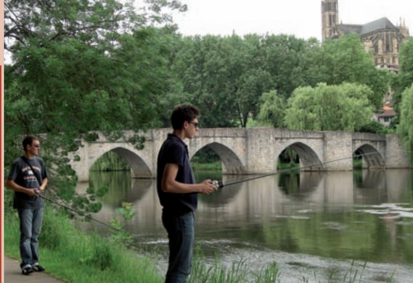
La nouvelle génération de pêcheurs Ponticauds est adepte du street-fishing

L'association est active au sein du Comité des fêtes des Ponts qui organise la fête populaire de la Saint Jean au Pont Saint Etienne à Limoges. C'est dans ce cadre que s'inscrit un concours de pêche aux carnassiers, dit concours street-fishing (pêche en ville), concept de pêche moderne qui a pris place sur les bords de Vienne depuis trois ans, en collaboration avec l'Association Française des Compétiteurs de Pêche aux Leurres (AFCPL).