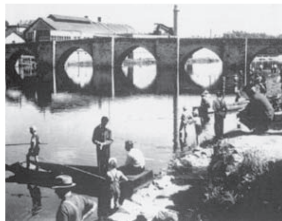
En 1953, le premier concours de pêche organisé pour les jeunes