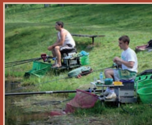
Les compétiteurs du « Team Sensas Les Ponticauds »