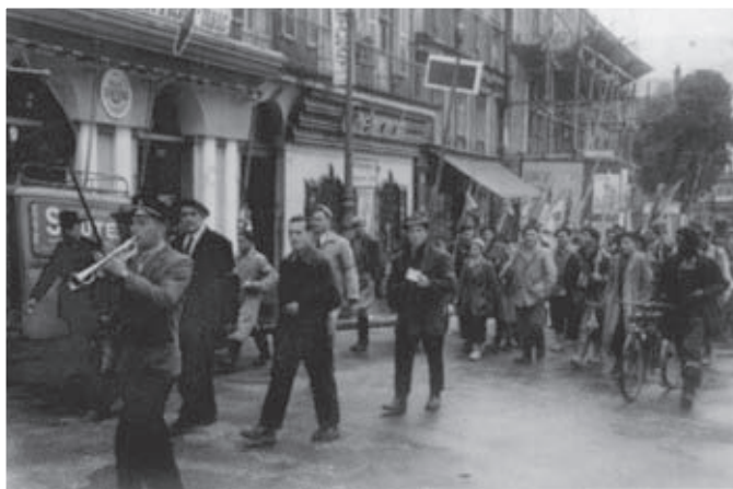
En 1954, 750 pêcheurs défilent en fanfare canne sur l'épaule

Au fil des ans l'association, devenue AAPPMA, prend de l'ampleur et assoit sa renommée.