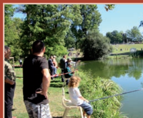
Le concours de pêche intergénérationnel « Bouge en famille » à Panazol